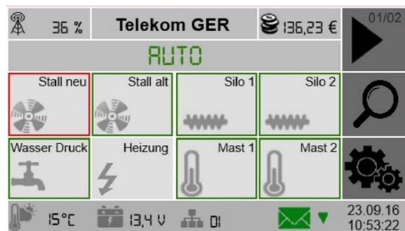
Bild: Anzeige Übersichtsmaske

Einstellungen am Gerät können über Touchfunktionen am Display oder über zusätzliche Tasten durchgeführt werden.