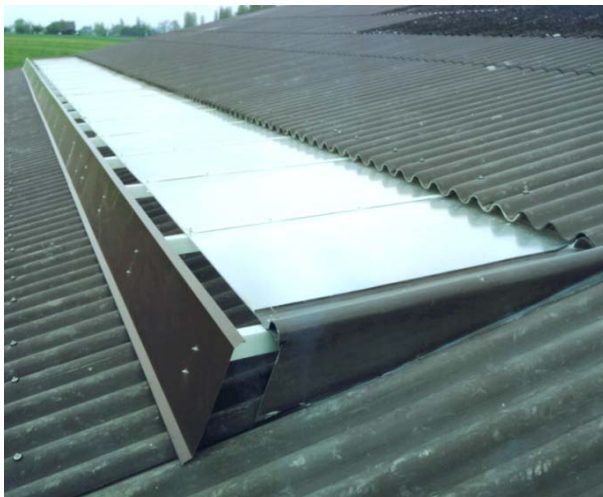
Bild: Integriert in Dachfläche...

«Hungerbühler Luft-Licht-Bänder werden in unseren eigenen Produktionsräumen komplett aus Kunststoff hergestellt. Keine Metallteile = tropft nicht. Einfache Montage für den Blitzschutz. Unsere transparente, hochwertige Qualität ist witterungsunempfindlich, hagelfest, wärme- und kältebeständig. Das Material zeichnet sich durch lange Lebensdauer aus, ist Licht stabilisiert, versprödet nicht, ist riss-, wind- und druckfest und schwer entflammbar. Alle Teile werden mit Chromstahlschrauben befestigt. Inklusive korrosionsfreiem Regenwasserabschluss und Staunase aus Kunststoff. Lieferbar mit stirnseitigem Endstück aus Polyester, für den Anschluss auf Eternit oder Ziegeldach (keine separate Spenglerarbeit notwendig). Drosselklappen für das Regulieren der Lüftung sind als Option oder auch später je nach Dachneigung noch möglich. Auf Wunsch Hohlkammerplatten mit Thermoschutz.»