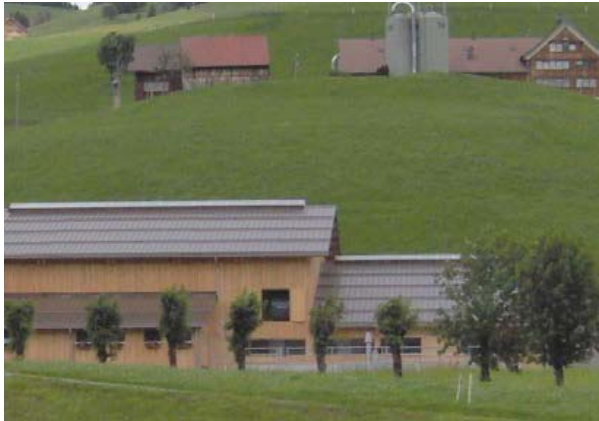
Bild: Luft-Licht-First auf Blechdach