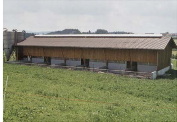
Bild: Für Schweineställe besonders geeignet dank kompletter Ausführung in Polyester (Mit oder ohne Drosselklappen)

Hungerbühler Luft-Licht-Firste in verschiedenen Typen mit Lichtmass von 0,8 bis 3.0 Meter und einem Lüftungsquerschnitt von 0,36 m 2 /lm. Ausführung mit oder ohne Drosselklappen für Warm- oder Kaltstall. Alle Typen mit beidseitigem Windabweiser und kompletten, stirnseitigen Abschlüssen auf Blech-, Eternit- oder Ziegeldach.