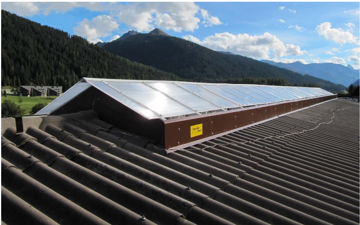
Bild: Luft-Licht-First auf Ethernitdach

« Hungerbühler Luft-Licht-Firste werden in unseren eigenen Produktionsräumen komplett aus Kunststoff hergestellt. Keine Metallteile = tropft nicht. Unsere transparente, hochwertige Qualität ist witterungsunempfindlich, hagelfest, wärme- und kältebeständig. Das Material zeichnet sich durch eine lange Lebensdauer aus, ist lichtstabilisiert, versprödet nicht, ist riss-, wind- und druckfest und schwer entflammbar. Die zur Verwendung gelangenden Lexan-Thermoclear-Platten® sind schlagzähe, energiesparende Hohlkammer-Platten aus Polycarbonat. Eingesetzt in doppelwandiger Ausführung bilden diese Hohlkammer-Platten eine kostengünstige und attraktive Lösung für eine Vielzahl von Verglasungen. Alle Teile werden mit Chromstahlschrauben befestigt. Aussenteile können nach Wunsch eingefärbt werden. »