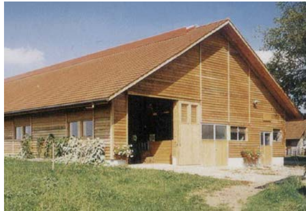
Bild: Luft-Licht-First auf Ziegeldach