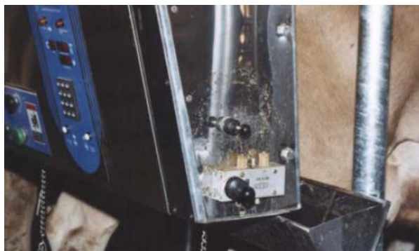
Bild: Pneumatische Bedienung

Öffnen und schliessen von Hand, elektrisch oder mit pneumatische Bedienung.