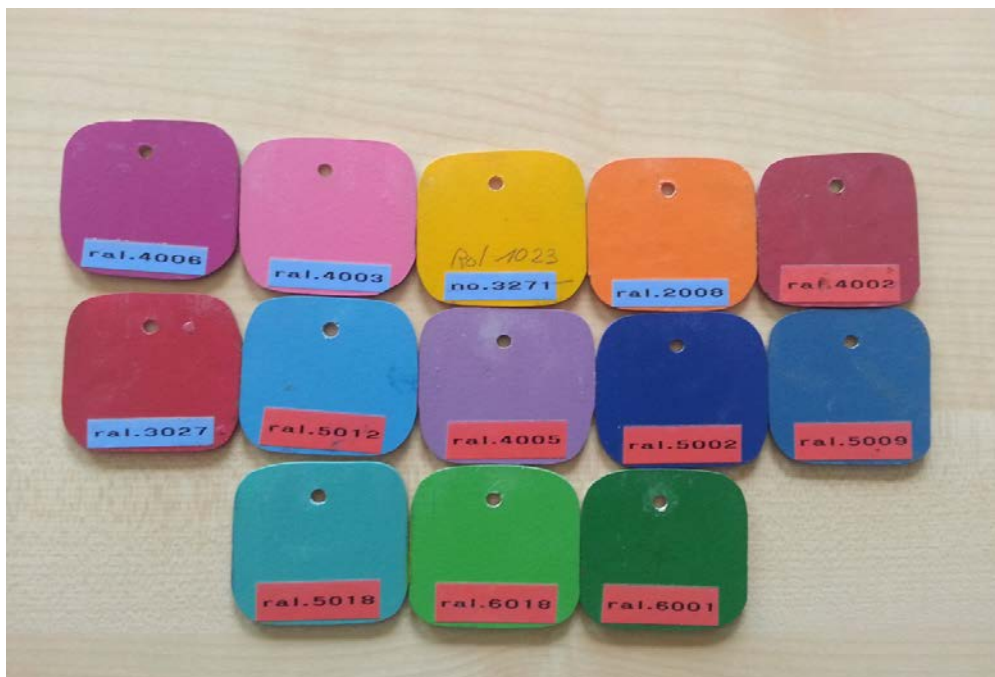
Farbmuster (nicht vollständig)